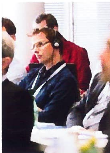
Une conférence au CRITTM2A, c'est en anglais. Alors, il faut des traducteurs.