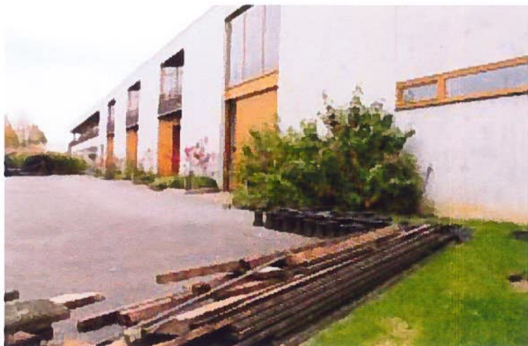
C'est l'arrière du bâtiment qui dans un premier temps va être réaménagé puis verra l'extension.

Dans l'espace de 700m 2 existant, en cours de rénovation, le site va accueillir des essais sur les batteries, le moteur électrique, la récupération de l'énergie électrique... L'an prochain, une extension de 700 m 2 sera également dédiée à ce projet. « Il y a de quoi faire dans le domaine. En 2020, 7 % des véhicules seront électriques. Et les véhicules traditionnels deviendront de plus en plus chers. » Le potentiel est là. Le centre de recherche l'a bien identifié et il compte bien devenir une référence mondiale pour l'électrique comme il l'est pour le turbo. ■