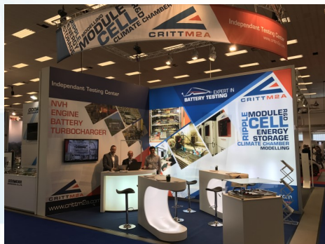
Electric & Hybrid Vehicle Technology Expo (4-6 avril 2017)

En 2017, le CRITT M2A a participé pour la première fois au salon Electric & Hybrid Vehicle Technology Expo , à Sindelfingen, pour y présenter son offre d'essais électriques qui y a été très bien reçue.