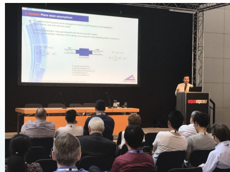
Engine Expo (20-22 Juin 2017)

Ces événements sont l'occasion pour le CRITT M2A de présenter son savoir-faire, d'affirmer sa notoriété et de nouer de nouveaux contacts tout en maintenant une veille technologique active sur les nouvelles tendances du marché. En 2017, le CRITT M2A a assuré deux présentations sur les mesures d'intensité acoustique dans les conduits du compresseur lors du salon Engine Expo à Stuttgart et du 23ème congrès Français de Mécanique à Lille.