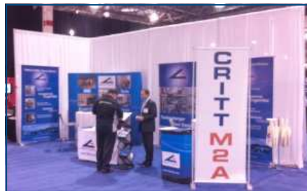
Automotive Testing Expo North America