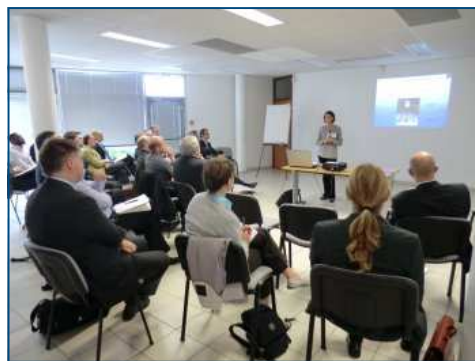
Conseil Scientifique de 11 octobre 2011

automotive testing expo 2011 north america